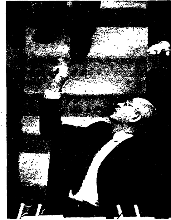
Una cunosa immagine di Mikail Gorbaciov