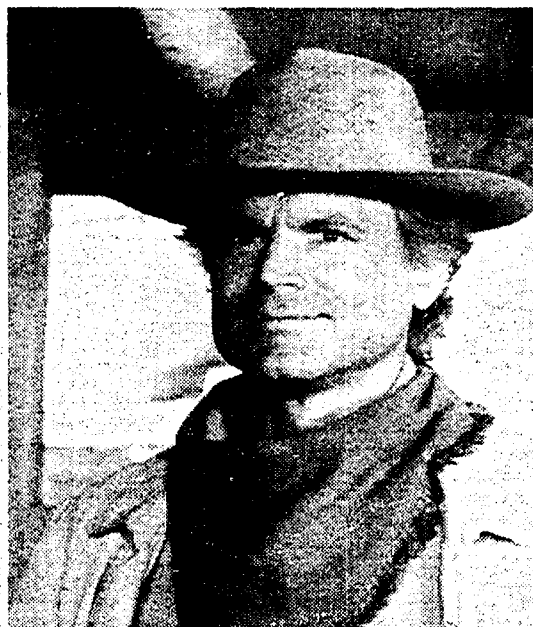
Terence Hill protagonista della serie tv «Lucky Luke»

Si conclude oggi il Mip di Cannes che non sembra aver risentito della congiuntura economica. A spingere sono stati i paesi emergenti. Oltre trenta nuove televisioni commerciali sono nate di recente solo in Europa. Buoni affari per Sacs e Fininvest. Incredibile persistenza sulla piazza delle cinque vecchie Piovre, che vengono ancora vendute in pacchetto unico in attesa della prossima serie.