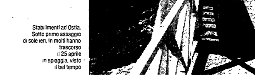
Stabilimenti ad Ostia. Sotto primo assaggio di sole ieri. In molti hanno trascorso il 25 aprile in spiaggia, visto il bel tempo