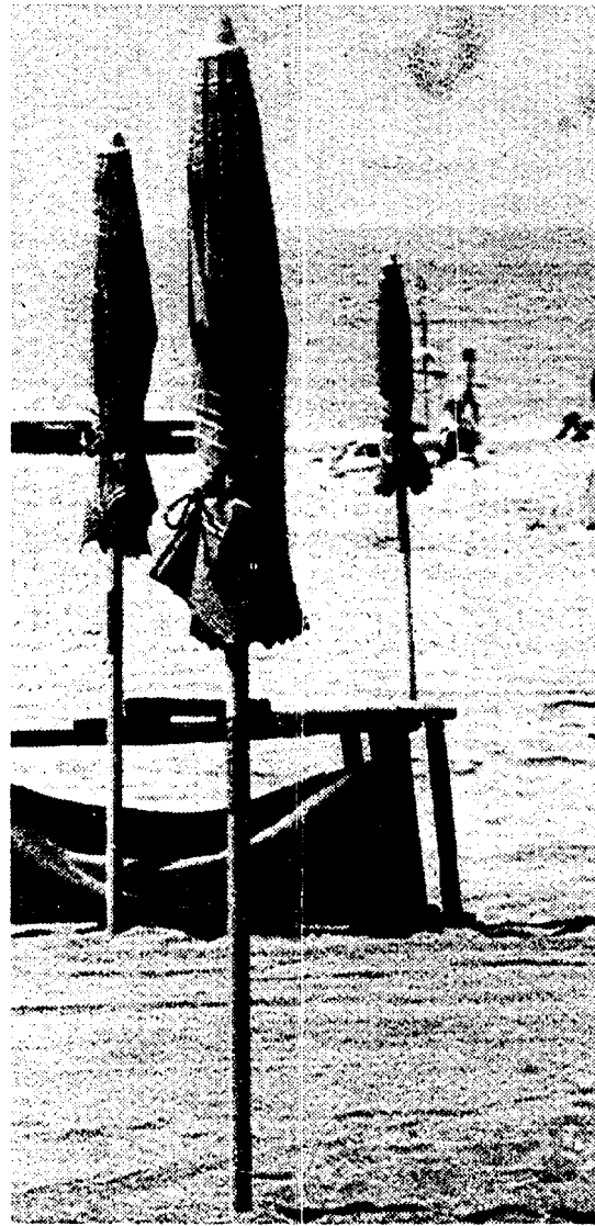
Una spiaggia del litorale romano

Con il 18,6% di coste sporche il Lazio dopo la Campania per i divieti di balneazione. Situazione migliore del '91