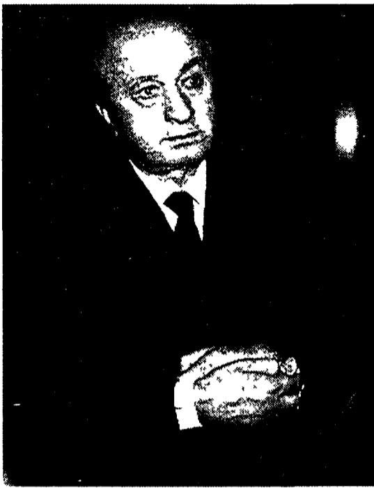
Ciriaco De Mita

«Il mio metodo questa volta si perfezionerà in un codice, che metterò a punto a Nusco», dice De Mita. E spiega: un presidente «per le riforme» eletto da uno schieramento che non coincida per forza con la maggioranza di governo.