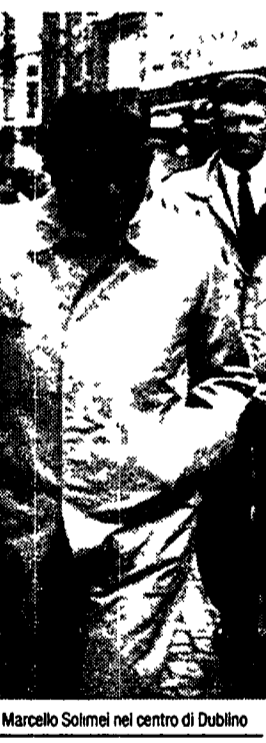
Cossiga a passeggio con l'ambasciatore Marcello Solmi nel centro di Dublino

giù duro: «Entrare nel Banco Ambrosiano con il 15 per cento - dice - e uscire dopo un mese con il 38, è un'operazione finanziaria da genio. Il tribunale ha detto invece che è un volgare ricatto. Siccome c'è la presunzione di innocenza fino a che la sentenza non è passata in giudicato, non posso dire che De Benedetti è un ricattatore».