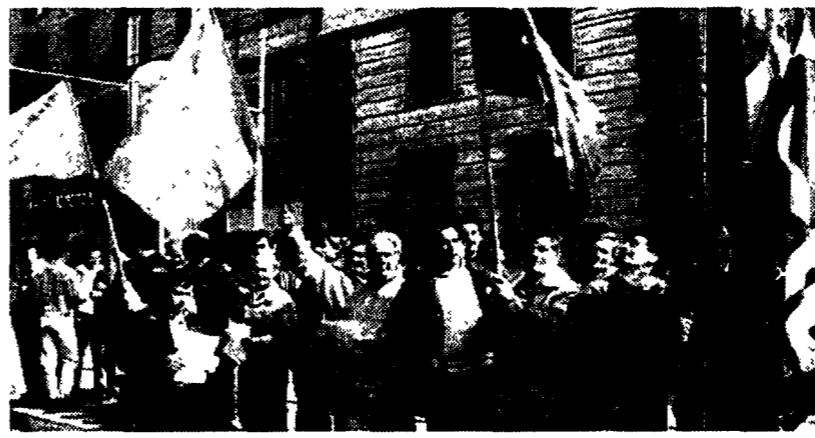
La manifestazione dei dipendenti Sip il 12 marzo scorso per denunciare i rischi di infiltrazioni mafiose

Festa del lavoro contro la mafia. La piovra nel Lazio è il tema di «otto» che la Cgil regionale ha dato alla festa dei lavoratori denunciando la penetrazione della criminalità organizzata nella regione.