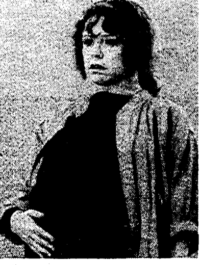
Qui accanto, Noni Hazlehurst (Clare) nel film «Amiche in attesa» di Jackie McKimmie