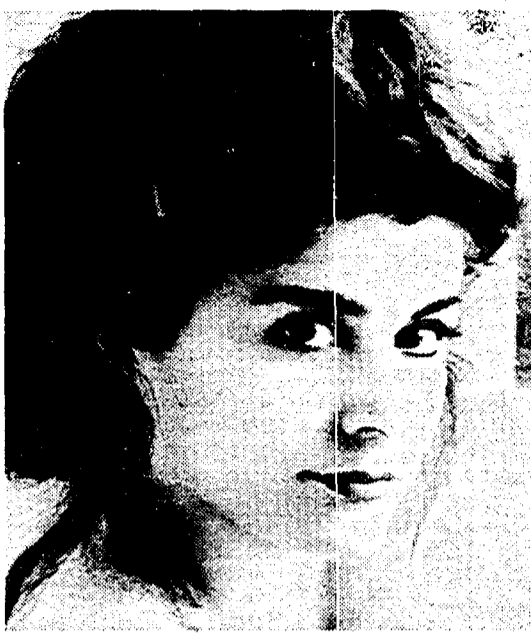
Cecilia Bartoli, protagonista domani a Firenze