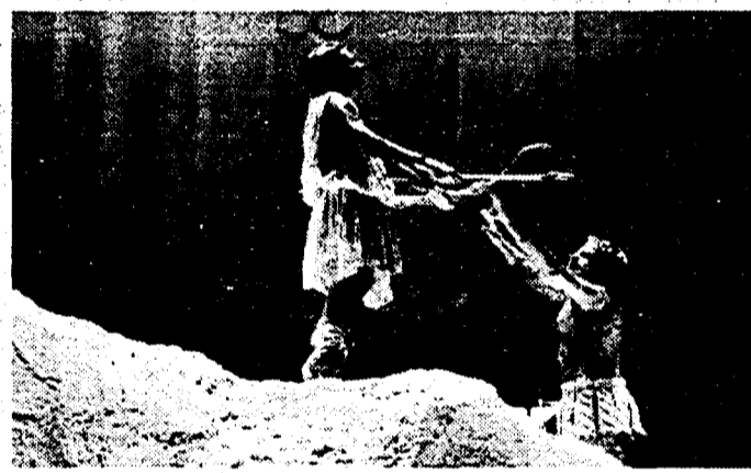
Una scena di «Filottete» messa in scena da Cristina Pezzoli