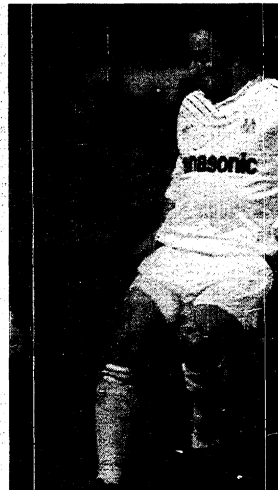
Papin, nuova stella della squadra rossonera, ieri in tribuna come spettatore. A sinistra la gioia dei milanisti ora ad un passo dallo scudetto. In alto la Ferrari di Alesi

la caduta è pure il Bari degli otto stranieri e dei quaranta miliardi spesi la scorsa estate per approdare in Uefa: il Cagliari, al quale basta solo un punto (e domenica c'è lo scontro diretto con i pugliesi), sorride largo. Mazzone, subentrato a Giacomini con la squadra ultima in classifica, ha raddrizzato la rotta alla grande e merita applausi convinti: il secondo scudetto della stagione, ideale, lo ha vinto lui. Ultime battute anche per l'Europa. La vittoria della Roma sul Parma e dell'Inter sul Genoa hanno permesso a giallorossi e nerazzurri di fare un bel salto in avanti. Al rush finale, sono loro le favorite. Esce di scena invece la Lazio, battuta a Milano. Ma l'addio, per gli uomini di Zoff, era nell'aria da un pezzo.