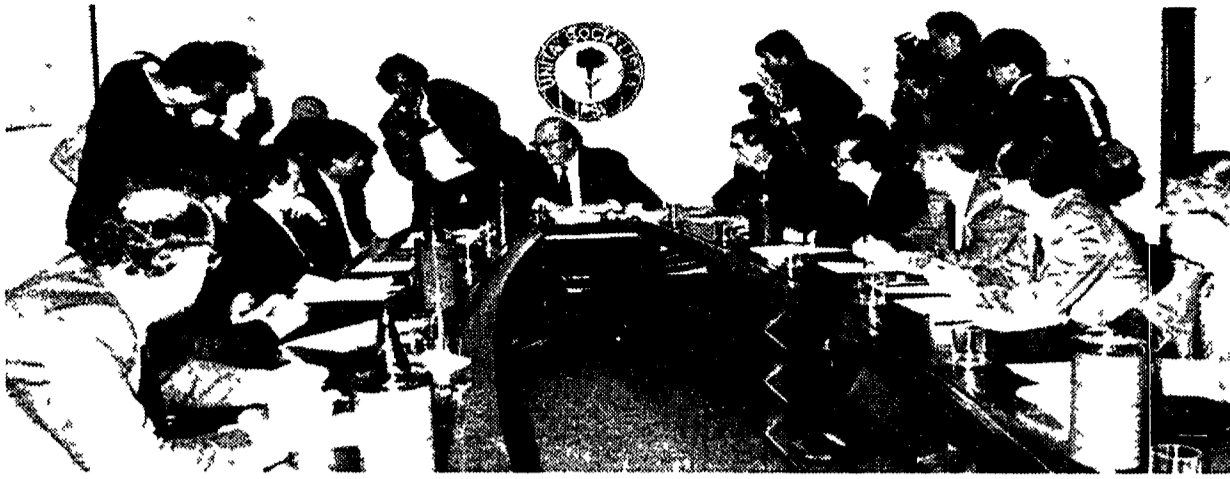
Un momento della riunione dell'esecutivo del Psi nella foto in basso il segretario del partito Bettino Craxi

Fiducia a Tognoli e Pillitteri dall'esecutivo socialista e il leader accusa: «Aggressioni e sciacallaggio non ci metteranno all'angolo»