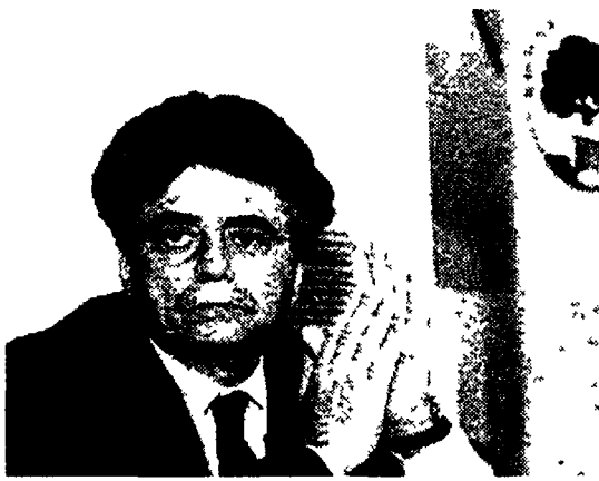
Achille Occhetto segretario del Pds

Un «preambolo» sulla questione morale che il Pds utilizzerà come bussola pregiudiziale per stabilire le proprie alleanze, dagli enti locali fino al governo nazionale.