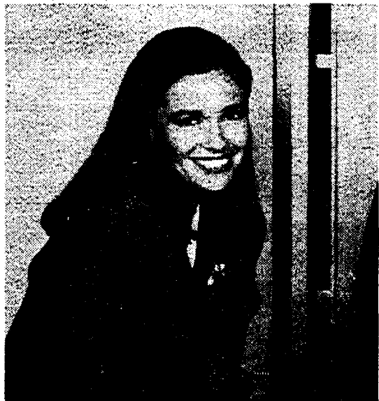
Cristina Parodi, conduttrice del Tg5