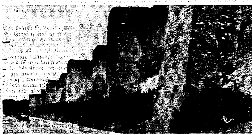
Un tratto delle mura aureliane

avvicinarlo per l'allegria dello spettacolo. Per l'insidia (i congiurati, ndr) avevano stabilito quest'ordine: Laterano, col pretesto di chiedergli un sussidio per necessità di famiglia, gettandosi in atteggiamento di supplice alle ginocchia del principe, l'avrebbe fatto cadere sorprendendolo e l'avrebbe tenuto sotto di sé, coraggioso e massiccio di cor-