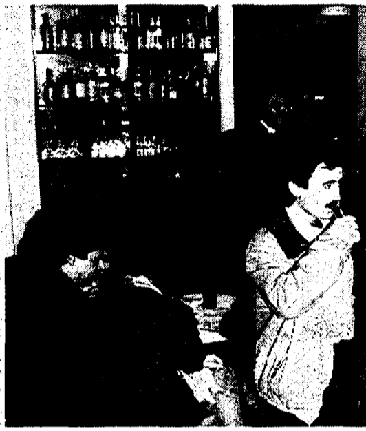
Un bar frequentato da giovani

«Un viaggio nel mondo dell'alcol». È quello condotto dagli operatori dell'Associazione psicologi e medici, un'associazione di volontariato che opera da oltre sei anni per il recupero degli alcolodipendenti. Il «viaggio» in questione ha riguardato la realtà giovanile, in particolare quella degli istituti tecnico-industriali della capitale, dove un'equipe di psicologi ha sondato, attraverso lo strumento del questionario, 608 studenti. I risultati delineano uno spaccato giovanile dove l'alcol, e in particolare la birra, è divenuto un diffusissimo «mezzo di comunicazione», un segno di identità di gruppo, un modo «trasgressivo» per marcare la propria presenza nell'anonimo «deserto metropolitano». Ecco i dati della ricerca. Innanzitutto il momento in cui è avvenuta la «conoscenza» dell'alcol: il 35 per cento degli intervistati ha assaggiato per la prima volta all'età di 11 anni una bevanda alcolica, e il 32 per cento da 12 anni ha un rapporto quotidiano con l'alcol. Il bere non è in alternativa all'uso di droghe: è quanto l'al-