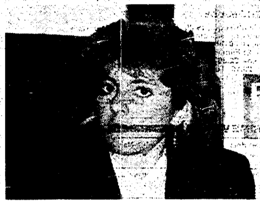
L'olimpionica Stefania Belmondo

Qualche esempio? La parete artificiale di free-climbing, il flying basket, il badminton, la canoa, le minimoto, l'equitazione, mountain-bike e tanti altri ancora. Saranno in totale ben 48 questi punti a disposizione dei visitatori che non avranno certamente la possibilità di annoiarsi. «Vieni, vedi e prova lo sport, per dodici ore al Campo di Marte». È questo lo slogan coniato dagli organizzatori che riassume la peculiarità di Cittàsport. Dalle dieci del mattino alle ventidue di sera sarà infatti possibile, oltre che visitare i vari stand ed assistere a tornei, esibizioni, eventi spettacolari, cimentarsi attivamente nella pratica sportiva. Un visitatore non passivo insomma che avrà modo anche di misurarsi con grandi campioni che saranno ospiti di Cittàsport. Occasioni forse irripetibili per il pubblico di ogni età. Da oggi al 17 maggio, per nove giorni, Firenze sarà la vera e propria capitale dello sport. Di questo ne sono consapevoli il Coni e il Ministero