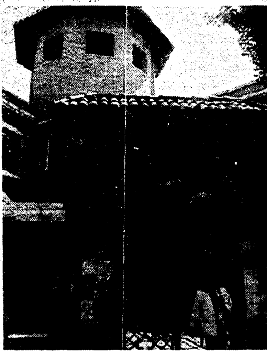
La sede della XIII circoscrizione

Urne aperte il 7 giugno La XIII circoscrizione rinnova il consiglio commissariato sei mesi fa