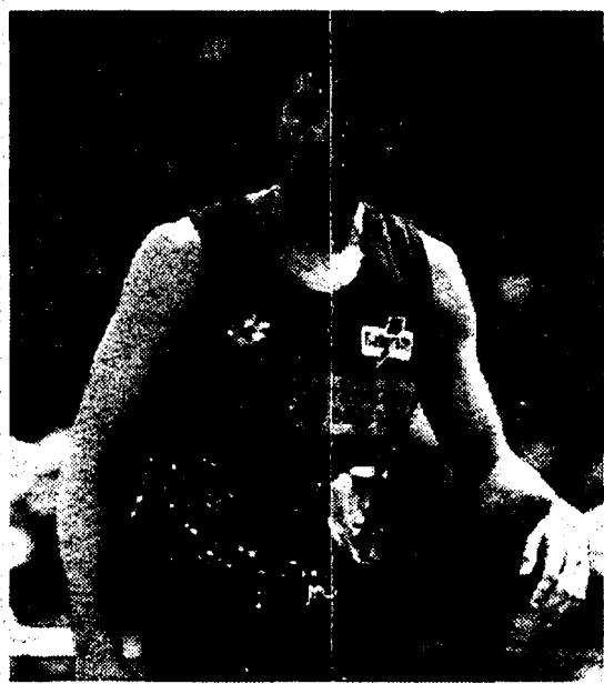
Toni Kukoc, 24 anni, grande protagonista della stagione-scudetto di Treviso