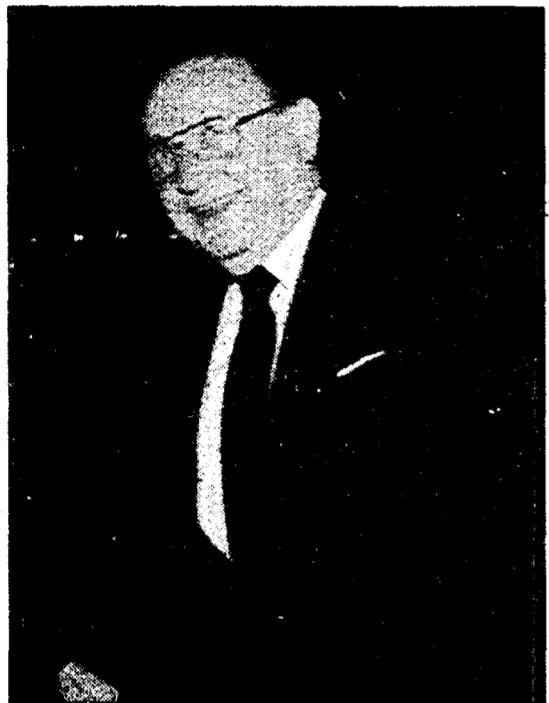
Hans Dietrich Genscher alla riunione della Cee

Duro avvertimento a Belgrado: ritirate le truppe