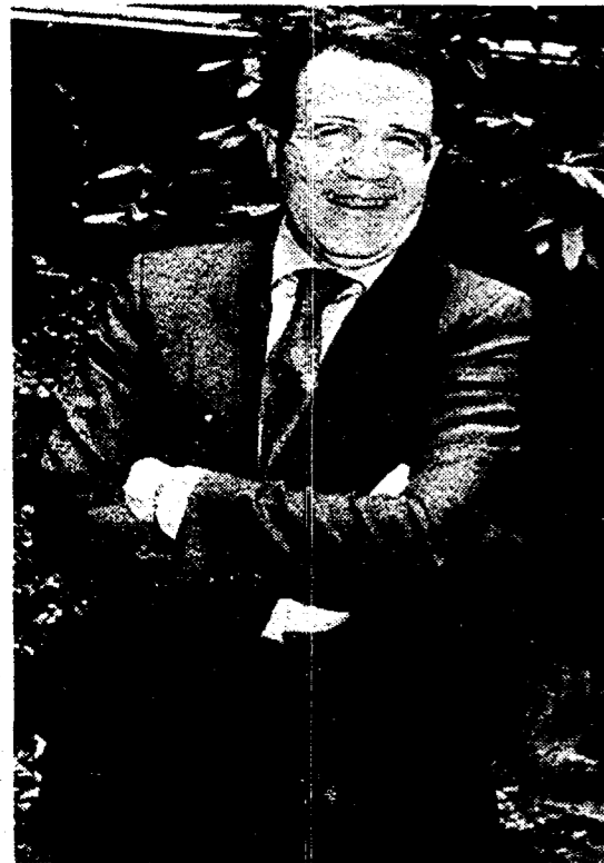
Romano Prodi spiega l'economia in tv