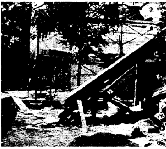
Il cantiere abusivo sequestrato sulle pendici del Pincio