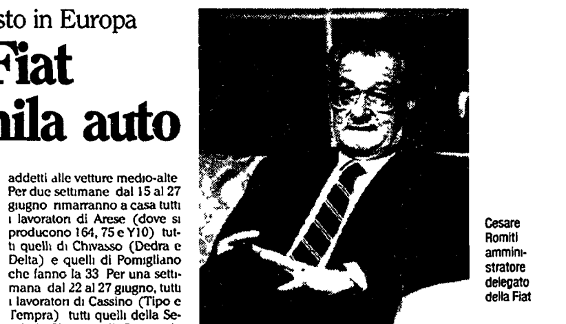
Cesare Romiti amministratore delegato della Fiat

crisi diramato dai sindacati è drammatico: ventimila cassintegrati (tra questi i Alfa e Italtel) di cui quasi 5 mila a zero