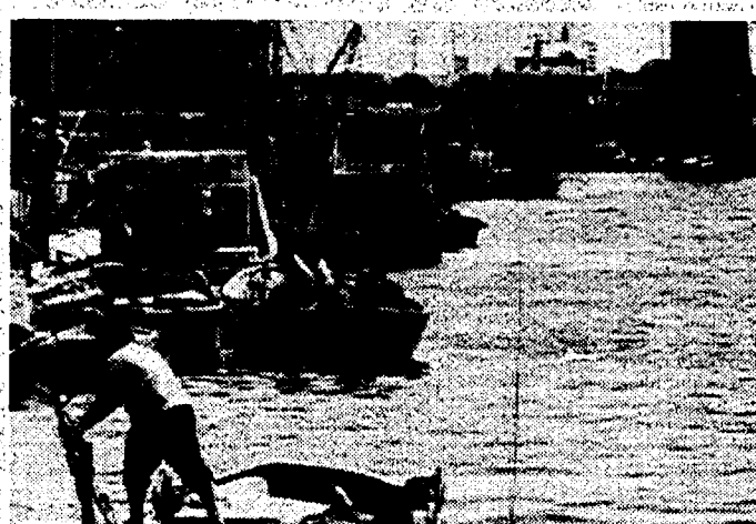
Barche ormeggiate a Fiumicino