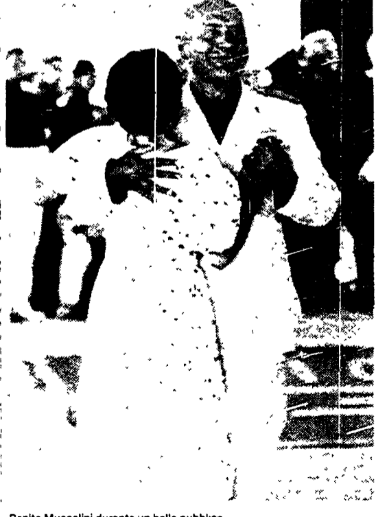
Benito Mussolini durante un ballo pubblico

Ed ecco che salta fuori anche una figlia «segreta» di Mussolini. Si tratta di Elena Curti, una signora di 69 anni che vive in Spagna e che ha affidato al settimanale «Gente» confidenze e dettagli.