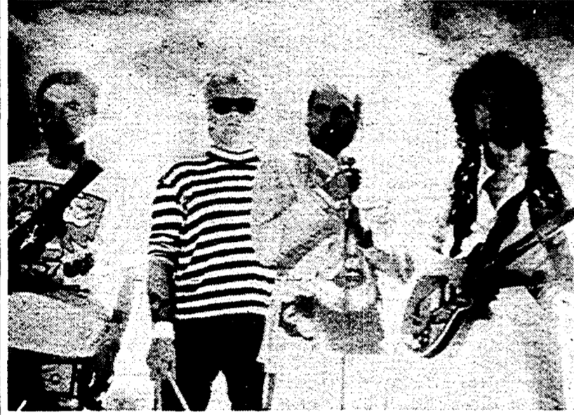
Queen: stasera su Italia 1

Ma non sarebbe giusto assistere al concerto solo per commemorare e ricordare lo scomparso. Tanto più che quando comincia la musica, la vitalità muscolare di Mercury e del suo gruppo fanno dimenticare ogni idea di morte. Si ascolta e si guarda, canzone dopo canzone, preda della seduzione operata sul pubblico, che siamo anche noi, benché postumi a tutti gli effetti. Un'ultima considerazione: anche questa emissione televisiva è un grande business. Infatti serve a lanciare l'ultimo ip, che peraltro non avrebbe bisogno di lanci. Ma, si sa, la morte è gratis. M.M.O.