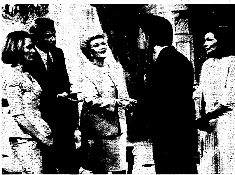
Una scena del neonato «Secrets»

MILANO. Denaro, potere, successo: sono o non sono i motori del mondo? E allora non c'è da meravigliarsi che siano gli ingredienti principali delle soap televisive. Le quali li equiparano al sesso, secondo il dottor Freud motore sotterraneo di tutto. Perciò anche Secrets, il serial italoamericano prodotto presso la sede Rai di Milano, tiene fermi i capisaldi del genere e della civiltà umana, raccontando la storia di una diva e del suo straricco fidanzato, che si amano da un continente all'altro tanto per complicare la vita degli scenografi. I quali comunque hanno il merito di aver riempito i tre Studi della Fiera di Milano di set pieni di romantici angolini, locali pittoreschi, letti a baldacchino di quelli nei quali una volta si diceva avesse dormito Napoleone (il più gran dormiglione d'Europa) e che ora si vedono solo in tv. Appunto per questo non abbiamo voluto perdere l'occasione di visitare i diversi ambienti prima che venissero smontati come succederà a giorni perché (miracolo!) il serial finisce proprio nei termini stabiliti e cioè entro maggio. Dunque la prima scommessa giocata da chi ha voluto realiz-