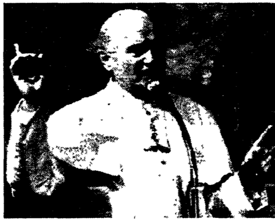
Giovanni Paolo II