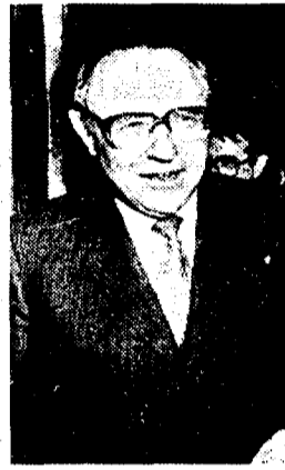
Carlo Azeglio Ciampi

La «cura» proposta dal governatore Ciampi per l'azienda Italia sarà sufficiente? E l'economia sarà in grado di sopportarla senza entrare in recessione e senza vedere drammaticamente calare i posti di lavoro?