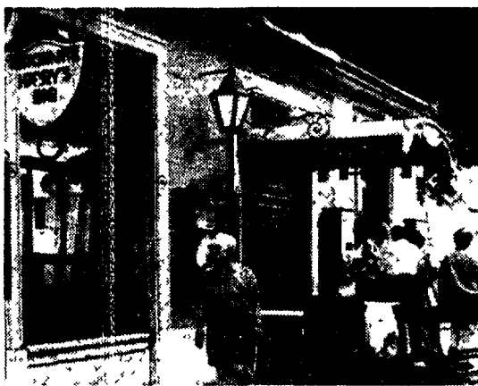
L'Harry's bar chiuso

Una gloriosa via trasformata in un indistinto assemblaggio di uffici commerciali, sportelli bancari, anonimi snack bar. È questo il futuro di via Veneto visto attraverso gli occhi del 17 dipendendell'Harry's bar.