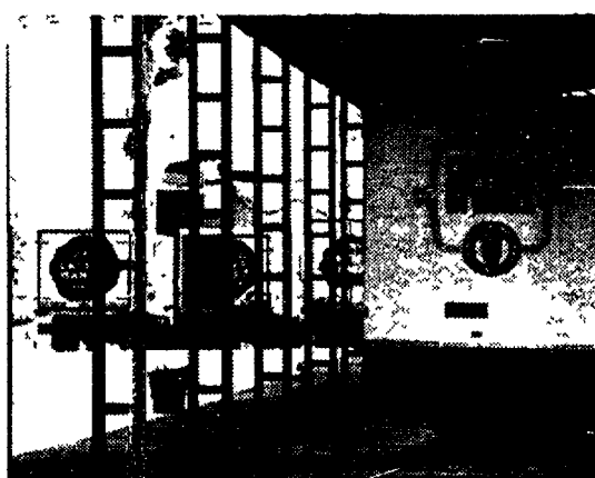
I camion della Centrale del latte e della «Latte sano»

Una svendita contrabbandata per efficienza. È quella della Centrale del Latte, una delle più grandi aziende del settore su scala europea.