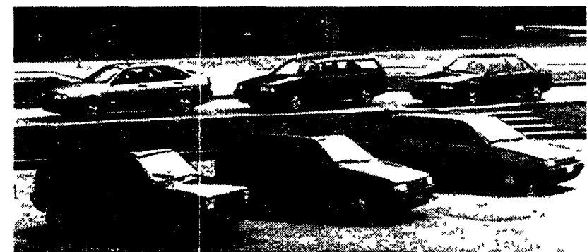
L'intera gamma Fiat con cambio automatico. Accanto al titolo, lo schema dell'ECVT della Panda Selecta