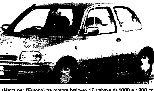
La Nissan March (Micra per l'Europa) ha motore bialbero 16 valvole di 1000 e 1300 cc. Nelle foto sotto: le Peugeot 205 Diesel Turbo e le 106 XT catalizzate e Sport da gara