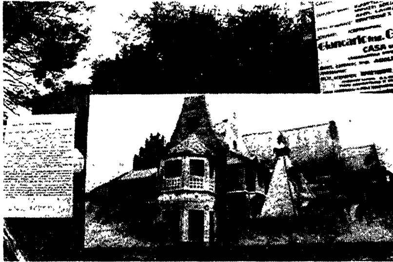
La Casina delle Civette a villa Torlonia

Restauro e polemiche per due delle più belle ville storiche romane che stanno cadendo a pezzi, Villa Torlonia e Villa Lais. Nella splendida dimora settecentesca dei conti Lais, acquistata nel '79 dal Comune, i lavori di restauro iniziali un anno fa sono stati interrotti perché i locali sono ancora occupati dai mobili della Usl.