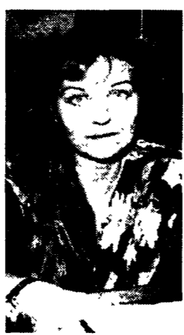
Loredana De Petris, consigliere verde

Nuovo giallo sull'ex Snia di largo Preneste. In un esposto alla magistratura i consiglieri Verdi accusano: «Concessione illegittima la zona è stata spacciata come destinazione M-3, cosa che non risulta sulle carte del Piano regolatore».