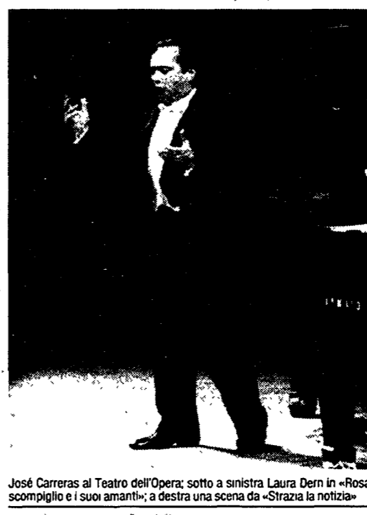
José Carreras al Teatro dell'Opera; sotto a sinistra Laura Dern in «Rosa scompigliato e i suoi amanti»; a destra una scena da «Strazia la notizia»

in palcoscenico) da una diletta ragazzina, Giulietta Masina che, messa a terra la borsa, prendeva la rincorsa per battere le mani, «pedalando» con i piedi, entusiasta come in un grido che volesse fermare il basta e incitasse l'ancora e ancora.