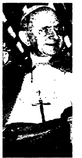
Papa Paolo VI

Nella girandola dei dossier è stata diffusa ieri una «lettera» che mons. Montini inviò il 13 marzo 1947 al vescovo di Pistoia perché si adoperasse a favore di Carlo Scorza. Questi figurava tra i responsabili della morte di Giovanni Amendola. Non è stato chiarito che il futuro Paolo VI era incaricato di occuparsi dei prigionieri di guerra e di quanti erano ricercati per atti politici delittuosi.