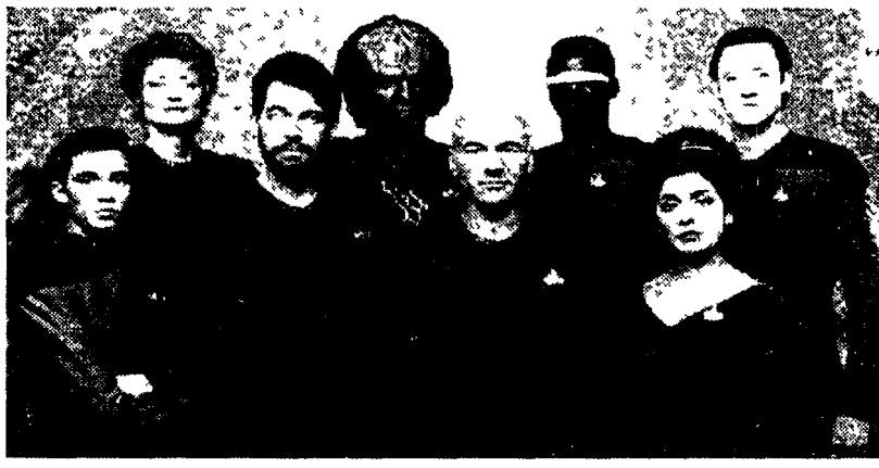
Il cast di «Star Trek la nuova generazione», a destra, i vecchi protagonisti

MILANO La notte è fatta per volare con l'astronave Enterprise, più in alto che si può lassù fino alla «nuova frontiera» come diceva la voce ispirata che presentava la vecchia serie tv intitolata Star Trek. E stanotte ci risiamo nello spazio profondo che il capitano Kirk conosce come le sue tasche con tutti gli alieni amici e nemici che hanno percorso E.T. Primo fra tutti ovviamente il venusiano Spock con le orecchie intergalattiche aperte a ogni possibilità stellare. E con lui le altre creature di un universo immaginato più che visto dall'interno clausrofobico di un astronave popolata da eroi in pigiama appartenenti a tutte le razze umane. C'era perfino il signor Cechov