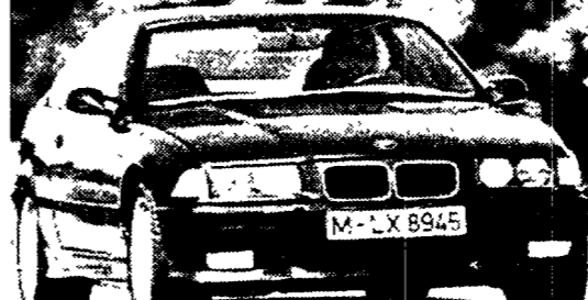
Come la precedente, la M3 E36 avrà catalizzatore e Abs