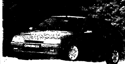
ZX 16V vera sprinter: 220 km/h, 0/100 km/h in 8"5