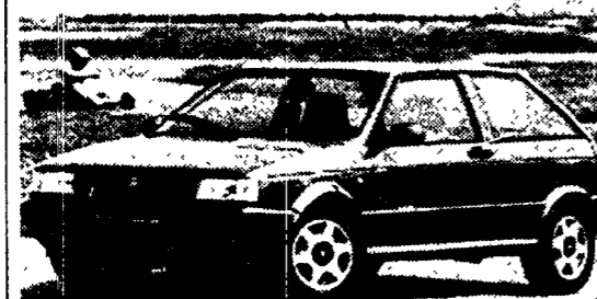
La Sport Line 1.7 Cat adotta un nuovo motore System Porsche