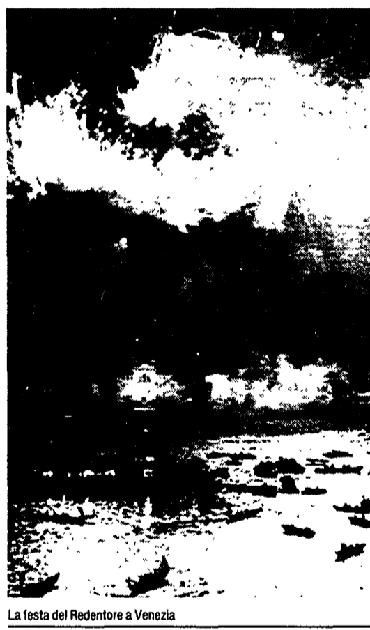
La festa del Redentore a Venezia

stimo lagunare sono proprio in luglio», dice l'assessore al Turismo Gianfranco Pontel. «Volete mettere con i numeri del Carnevale, quando si arriva alle 140 mila presenze? Pol saremo tutti in barca e la laguna è di 50mila ettari».