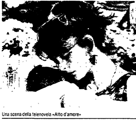
Una scena della telenovela «Atto d'amore»