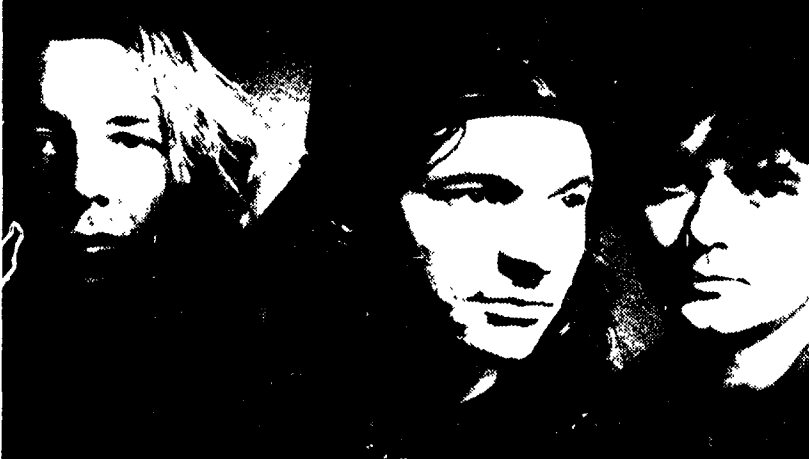
Gil Young Gods, uno dei gruppi che si è esibito ad Arezzo Wave