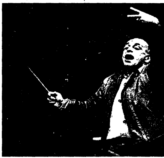
Il direttore d'orchestra Lorin Maazel

Di solito la curva sud dell'Olimpico ospita i tifosi della Roma. Ieri sera, invece, allo stadio sono accorsi ventimila appassionati per ascoltare la «Nona» sinfonia di Beethoven diretta da Lorin Maazel. Spalti gremiti per un evento senza precedenti. Una rivincita per le nutrite schiere dei «musicofili», anche se alla fine dell'esecuzione la parte «calcistica» del pubblico ha fatto sentire la sua voce.