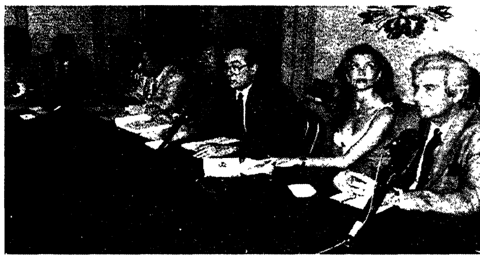
La conferenza stampa di presentazione di «Donna sotto le stelle».