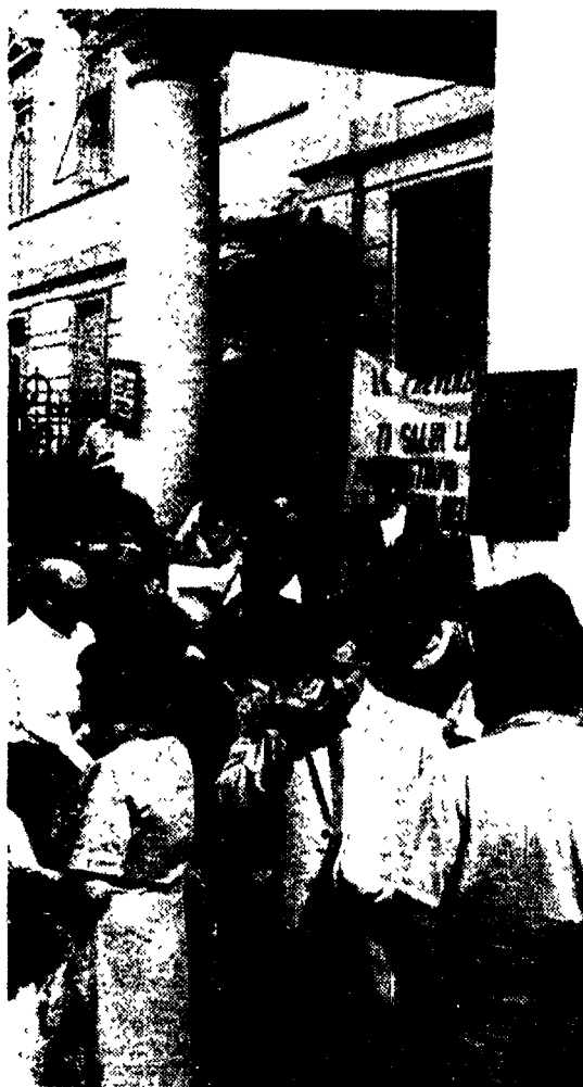
Sos per il centro antitumori. Protesta al Regina Elena

Prenotazioni bloccate, personale medico ridotto all'osso e, come se non bastasse, il sospetto che l'amministrazione abbia deciso la chiusura definitiva del servizio. Sono queste le ragioni che hanno spinto il personale medico del centro di prevenzione tumori dell'ospedale Regina Elena - l'unico servizio pubblico che svolge un'attività del genere - a manifestare ieri mattina davanti ai cancelli. «Per fare il nostro lavoro - hanno detto ieri i medici - abbiamo pochissimo personale. Tanto che le visite sono state ridotte drasticamente e le liste d'attesa prevedono code anche di sei mesi. Proprio in questi giorni poi, le prenotazioni sono state bloccate del tutto. I problemi nasceranno da una volontà di chiusura del servizio, volontà di cui si parla esplicitamente nel piano di ristrutturazione dell'ospedale. «Ufficialmente - dicono ancora i medici del Centro - il blocco è motivato dalla pausa estiva, ma noi siamo convinti che si tratti di una manovra per scoraggiare gli utenti ed arrivare così alla chiusura definitiva».