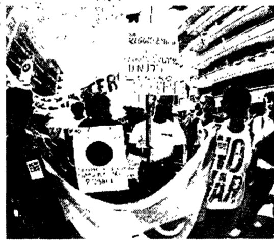
Giovani durante una marcia antimafia