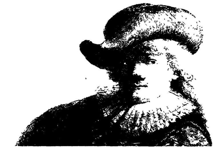
Rembrandt. Autoritratto con cappello morbido e mantello ricamato (1631)

do, per l'appunto, sul letto di un lago. Mille e mille le attrazioni in Olanda, dai paesi dei pescatori alle cittadine con splendidi centri storici. L'età d'oro di questo piccolo stato è il Seicento. È allora che si è verificata una straordinaria fioritura culturale tanto che l'Olanda di quel secolo può essere paragonata all'Atene di Eschilo e di Fidia o alla Firenze di Masaccio e Brunelleschi. Il grande storico Johan Huizinga, morto nel '45 in un carcere nazista, scrisse che nella prima metà del '600 «la Repubblica olandese è l'unico paese che in quel tempo raggiunga lo zenit in tutti i campi come stato come potenza commerciale, marinara e industriale come centro delle arti e delle lettere». E nel XVII secolo che sono vis-