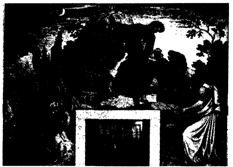
Dipinti di Villa Massimo: Dante dormiente e incontro con Virgilio

In questo curioso lavoro, in cui venivano tratteggiate in maniera romanzata le figure di importanti pittori del Rinascimento italiano, si proponeva una visione del Medioevo ideale e chimerica. Il pittore era rappresentato come uno