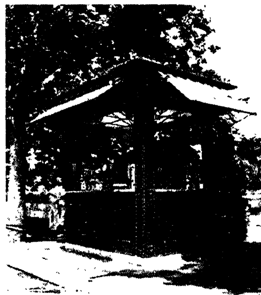
Il chiosco di grattachecche «Alla fonte d'oro» quando era aperto