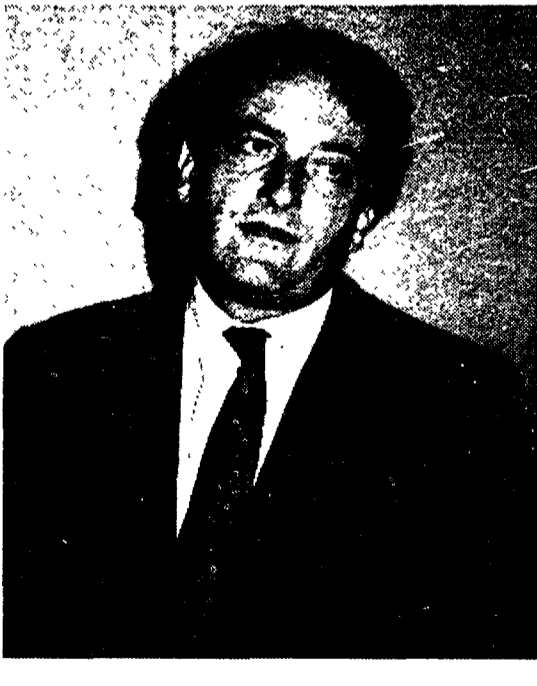
Luigi Abete, presidente della Confindustria, in alto la Borsa di Milano ieri e nel grafico le chiusure di dollaro e marco al fixing di Milano.

Ma che fare? La domanda continua a galleggiare, sospesa nell'angoscia. «Dobbiamo subito mettere in moto effetti in senso contrastanti».