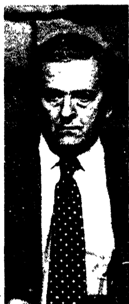
Carlo Ripa di Meana

Il ministro Ripa di Meana, «molto addolorato» per i lavoratori dell'azienda, conferma nella sostanza le sue opinioni: per l'Acna non c'è rimedio, va chiusa.