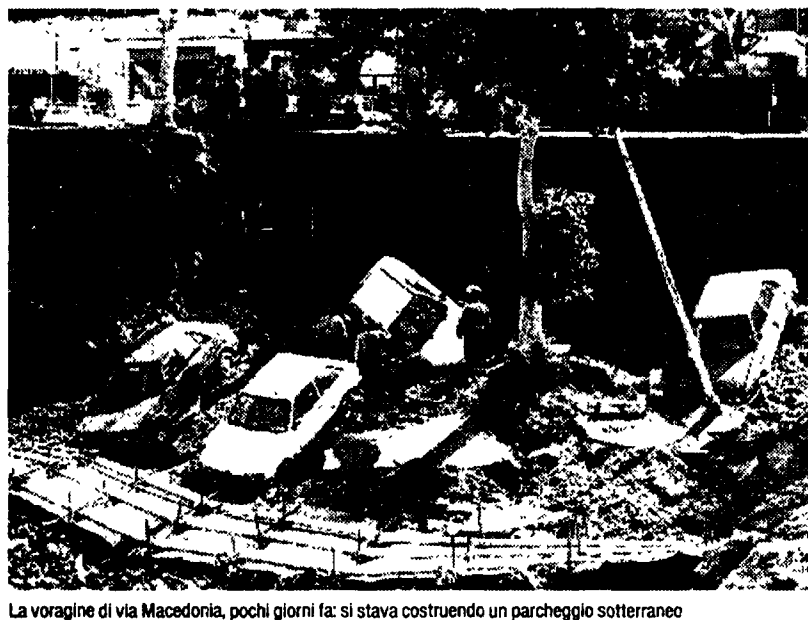
La voragine di via Macedonia, pochi giorni fa: si stava costruendo un parcheggio sotterraneo

Su una cartina del centro storico, gli ambientalisti di Italia Nostra hanno localizzato i 49 parcheggi destinati al cuore della città. Da un attento esame si scopre che tutti i posti auto sorgono su reperti archeologici.