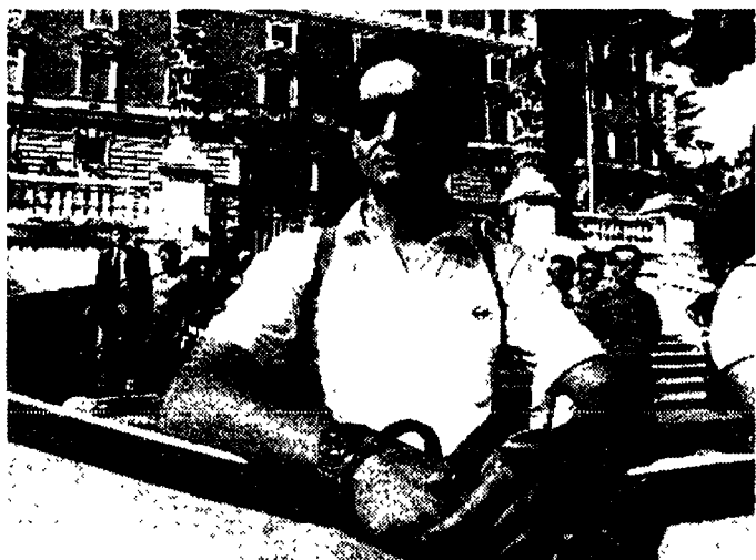
La protesta degli agenti del «Lisipo», ieri, al Viminale