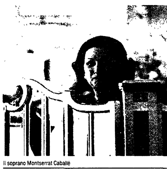
Il soprano Montserrat Caballé