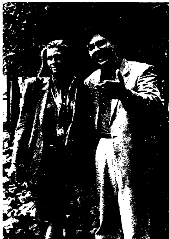
Fabrizio Frizzi e Martina Colombari, Miss Italia 1991