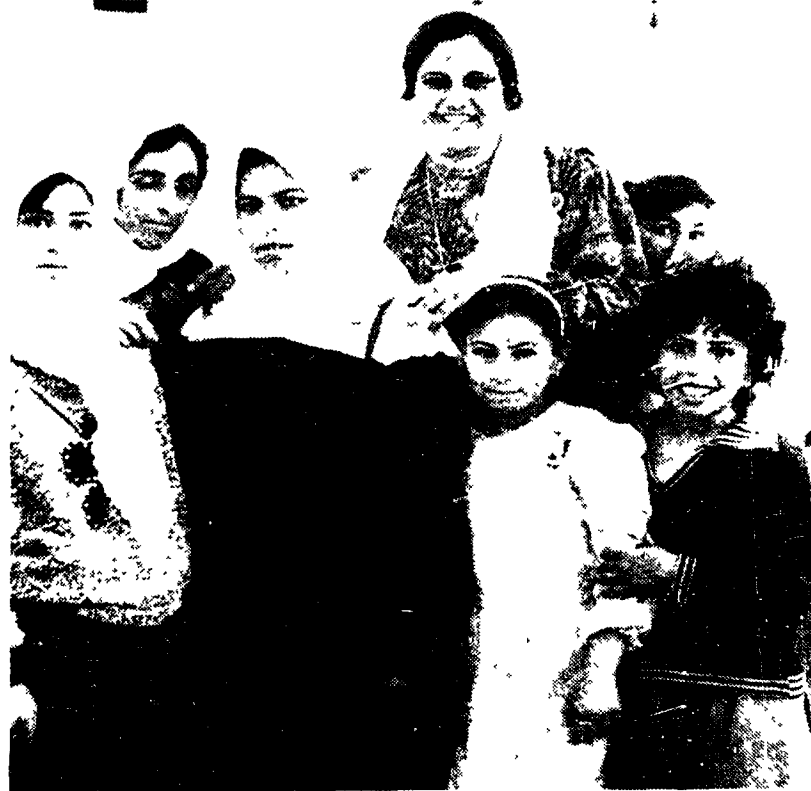
Donne palestinesi in un villaggio di Hebron (1991)