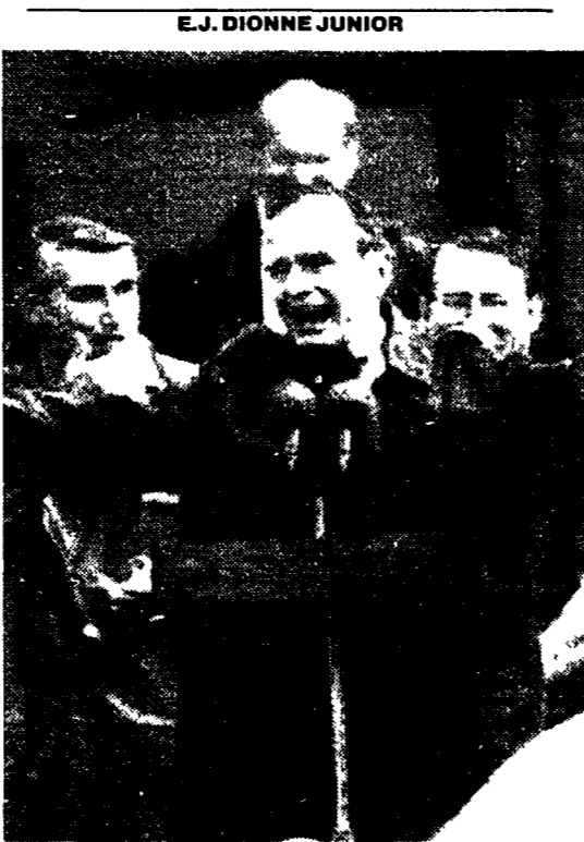
Il presidente americano George Bush durante la campagna elettorale